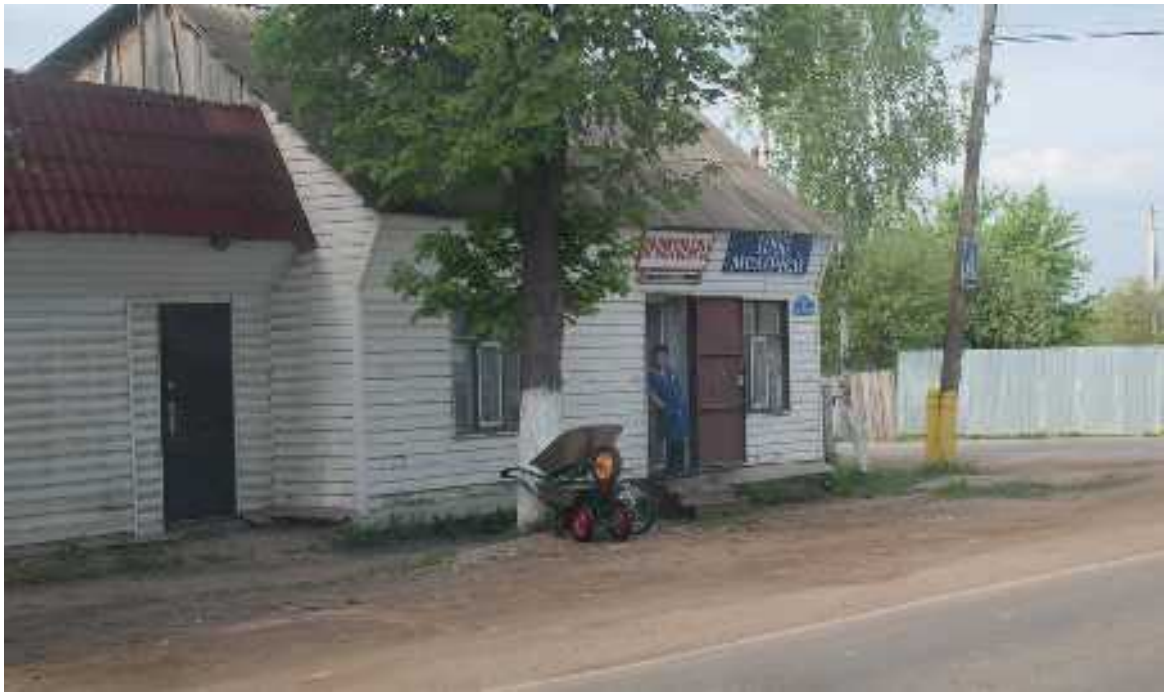
Магазин «1000 мелочей». Сразу за ним – нужный поворот.

После поворота едем прямо, до Кондрово. Это километров 10.