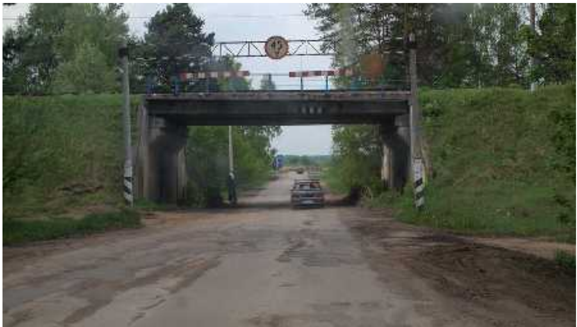
Съезд с моста. Дорога просто отвратная. Далее, почти все время такая.