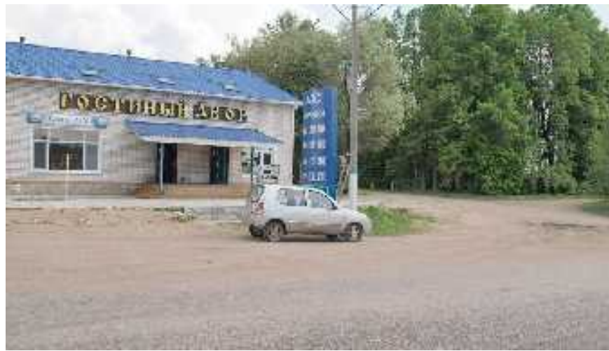
Магазин в Воронках