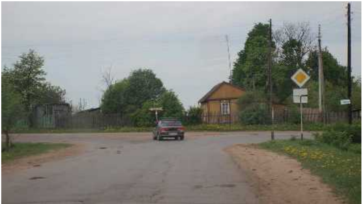
Едем по главной дороге