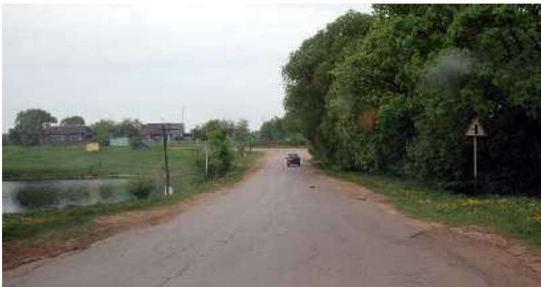
Дорога убойная. Народ едет, как может.