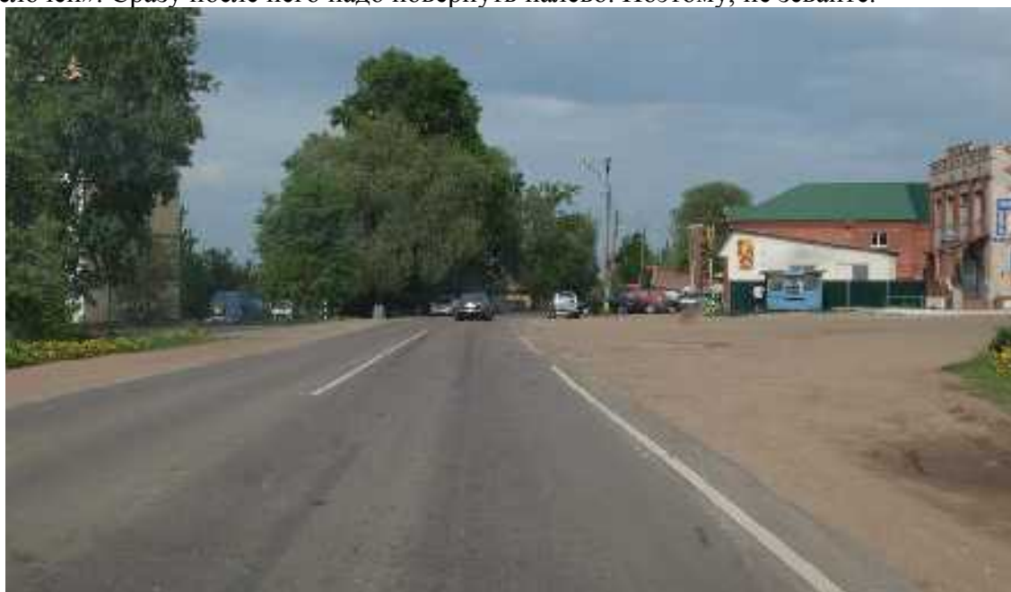
Въезд в Медынь

Как доехать до Медыни, писать не буду. Это довольно крупный город и есть на всех картах. После въезда в Медынь необходимо внимательно следить за правой обочиной – нам нужен магазин «1000 мелочей». Сразу после него надо повернуть налево. Поэтому, не зевайте.