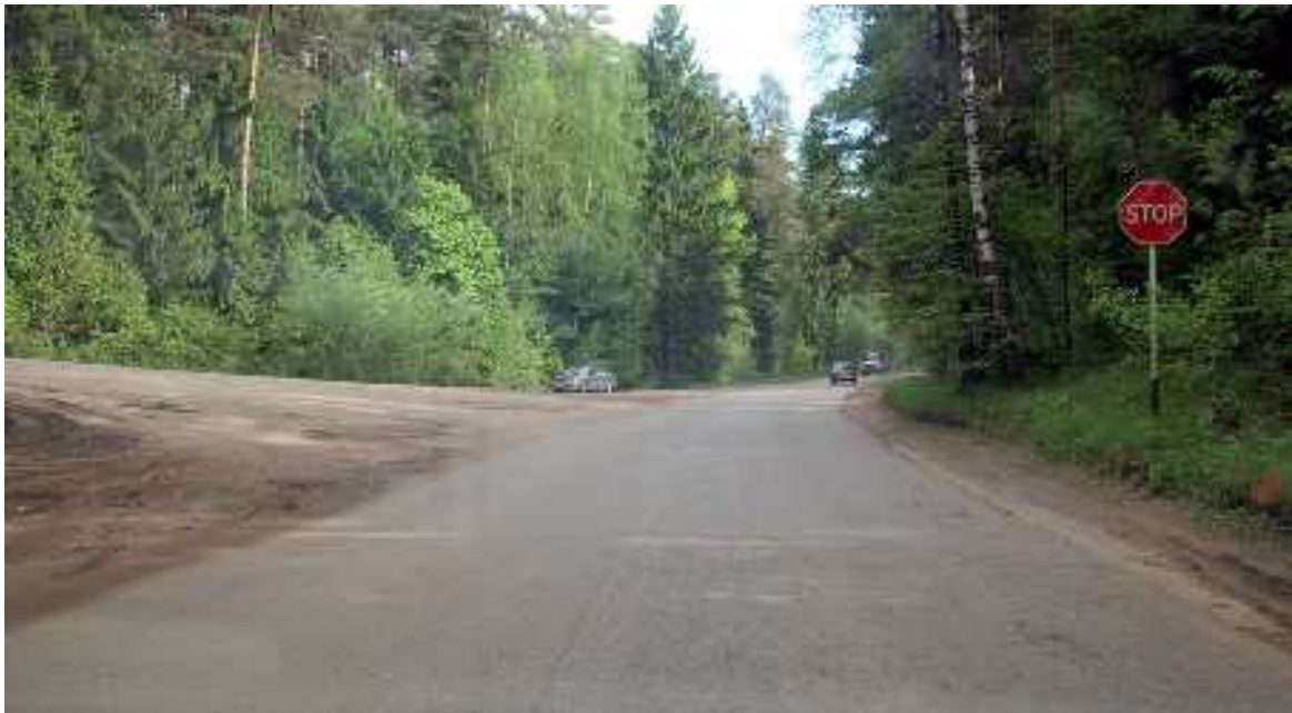
Важная точка. Поворот налево, в горку, на мост.