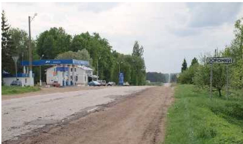
Со стороны Медыни, поворот налево сразу за заправкой

Проезжаем Медынь насквозь. На выезде – пост ГАИ и дорога под горку, будьте внимательны, не гоните. Едем до деревни Воронки. Это километров 25 от Медыни или километров 30 от Юхнова (для тех, кто будет ехать со стороны Смоленской области). В Воронках есть заправка, сразу за ней – поворот налево.