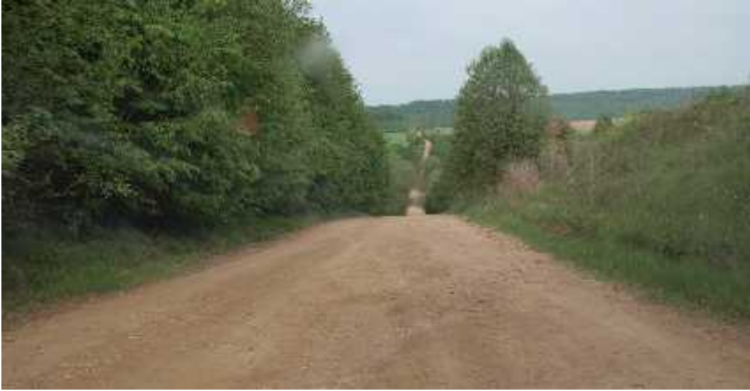
Спускаемся с горки