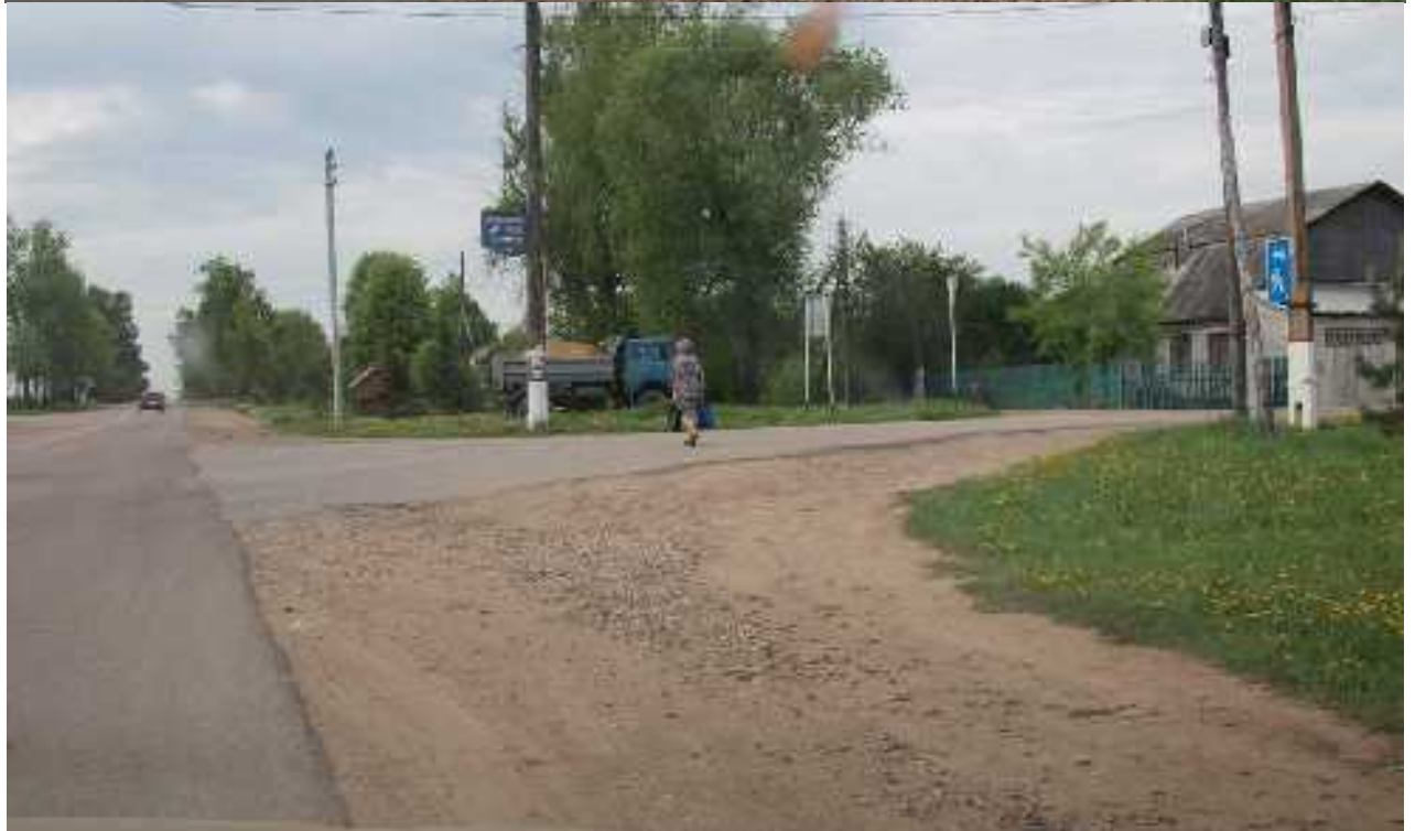
Поворот на Острожное.