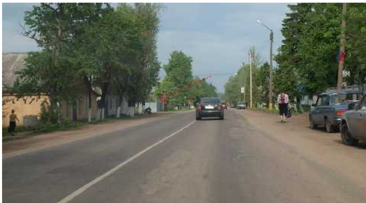
Нужный поворот (см. стрелку)