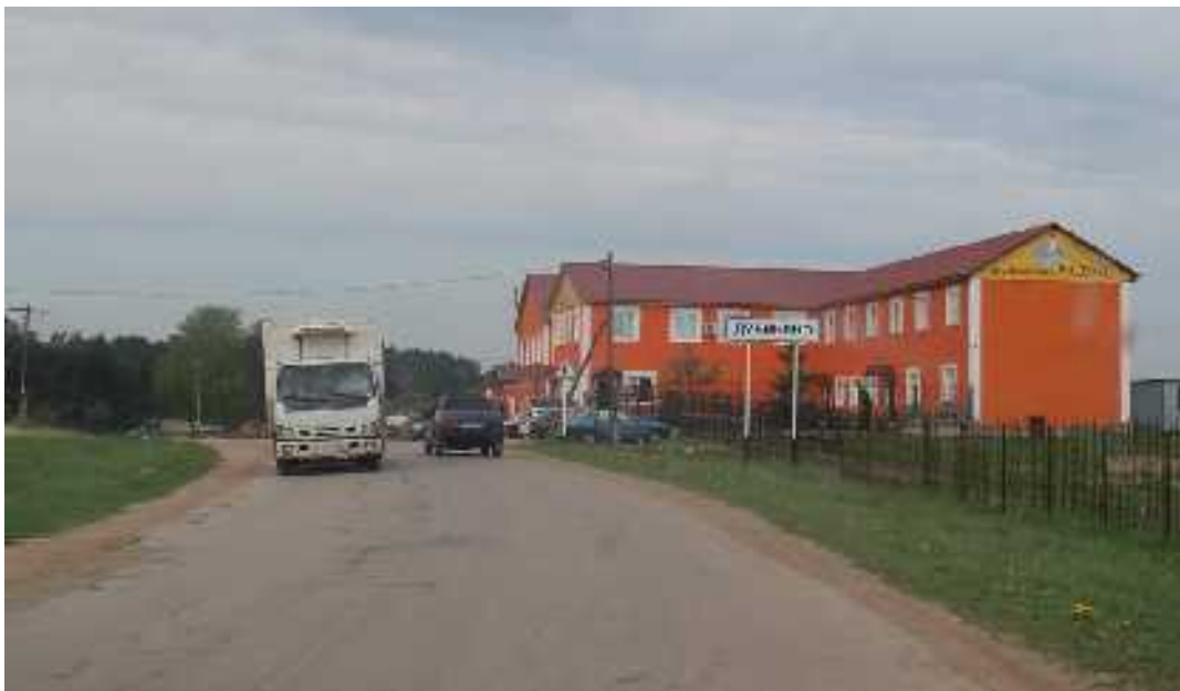
Птицефабрика «Радон». Название наводит на разные мысли. Да и Обнинск недалеко....