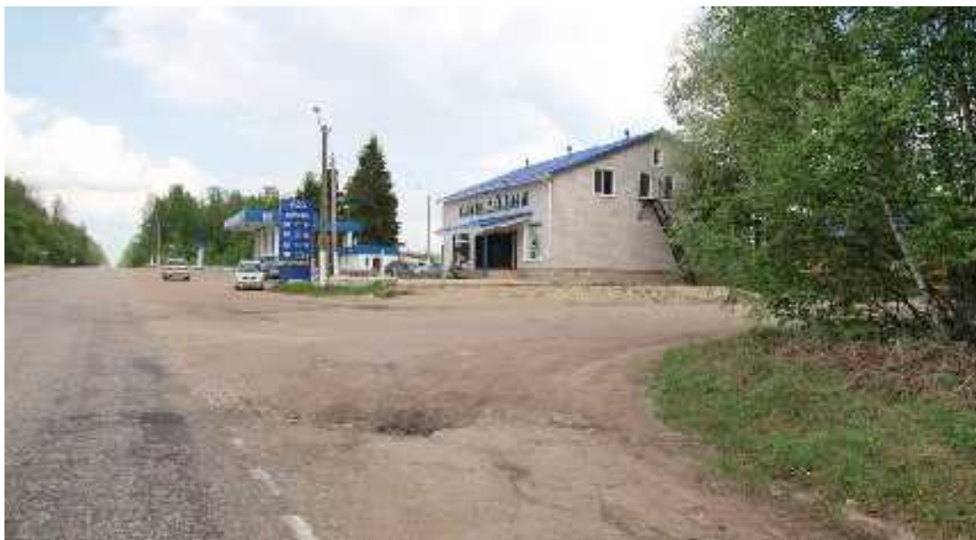
Со стороны Юхнова – поворот направо.