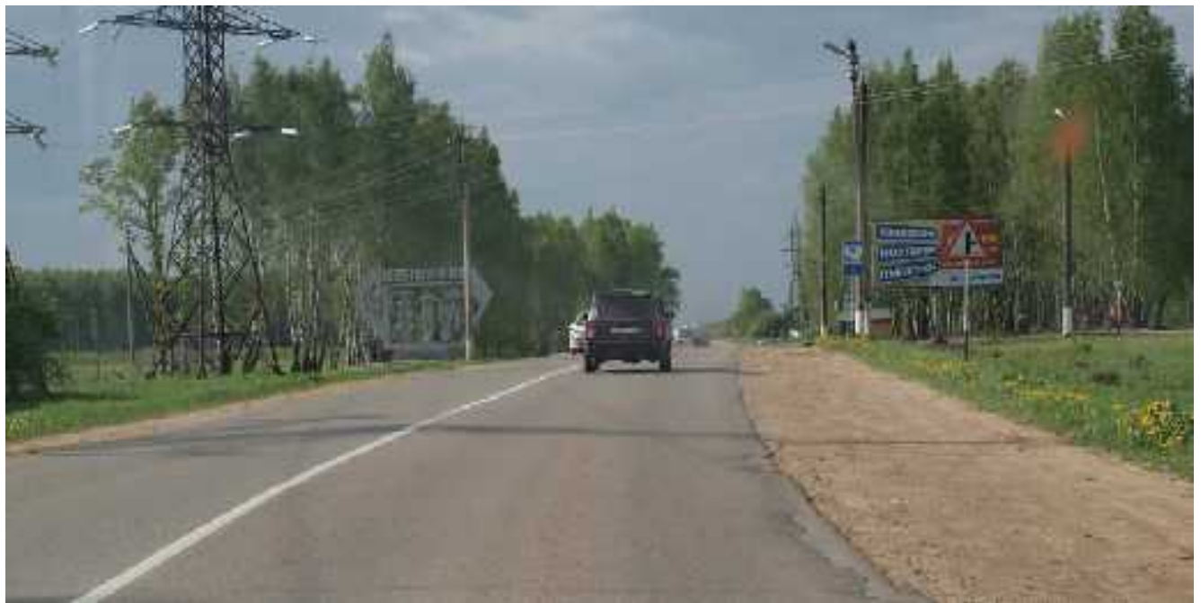
Въезд в Кондрово

После поворота едем прямо, до Кондрово. Это километров 10.