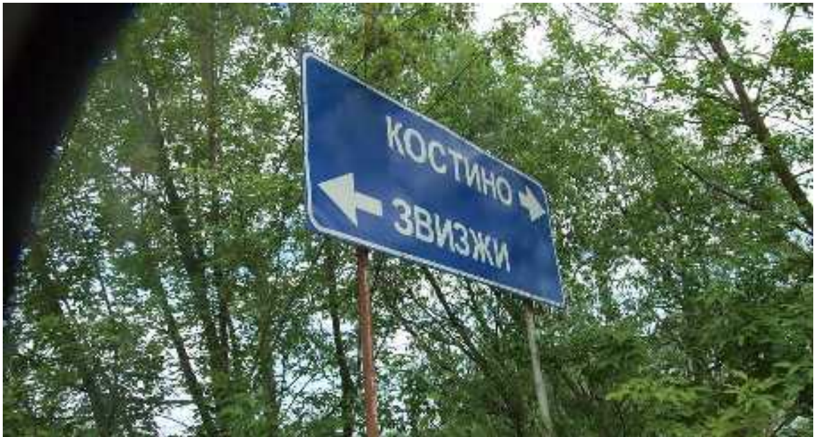
Следим за указателями