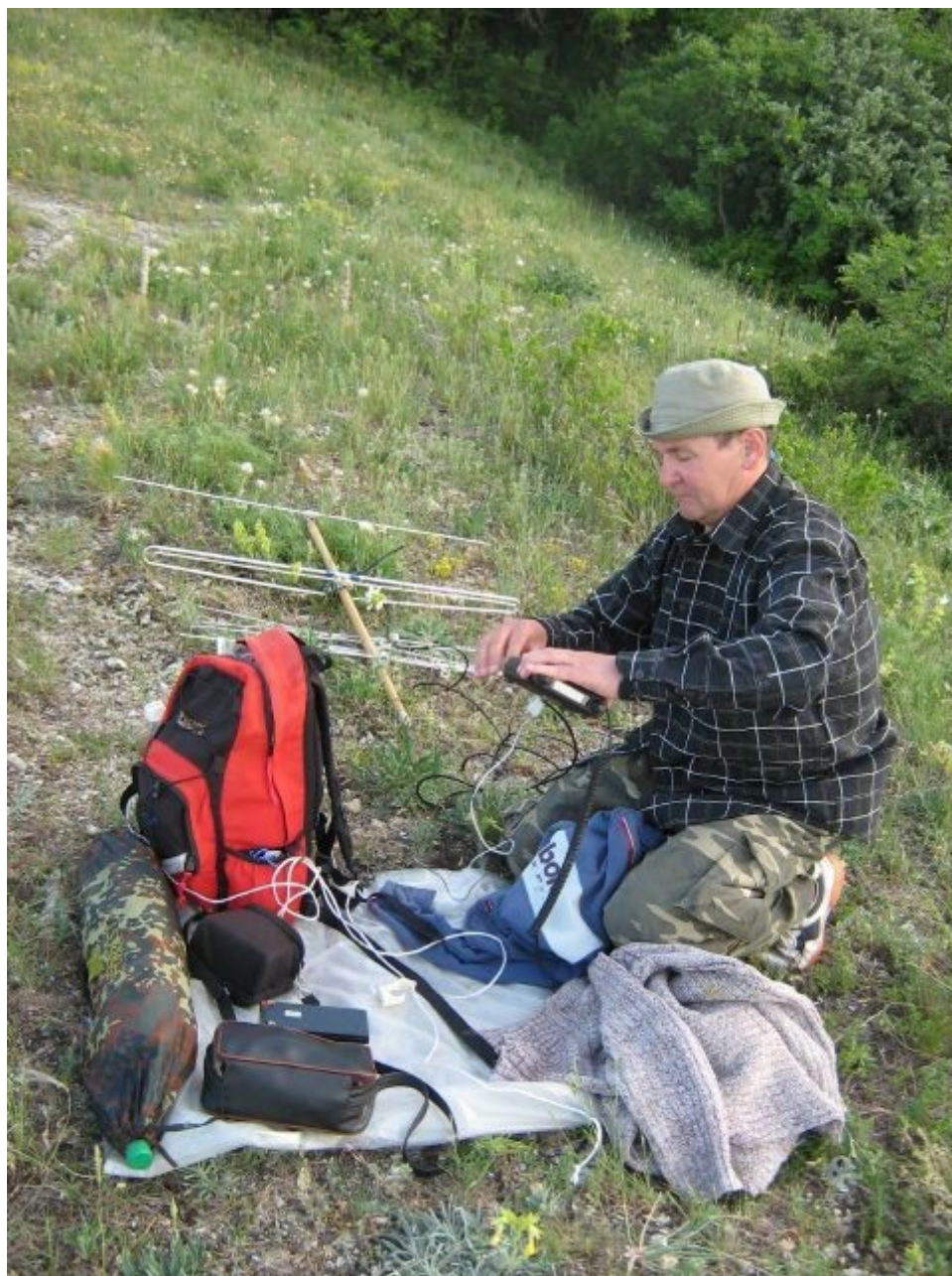
US2IFR готовит УКВ

Владимир рядом разворачивает позицию на 144мГц, взаимных помех замечено небыло.