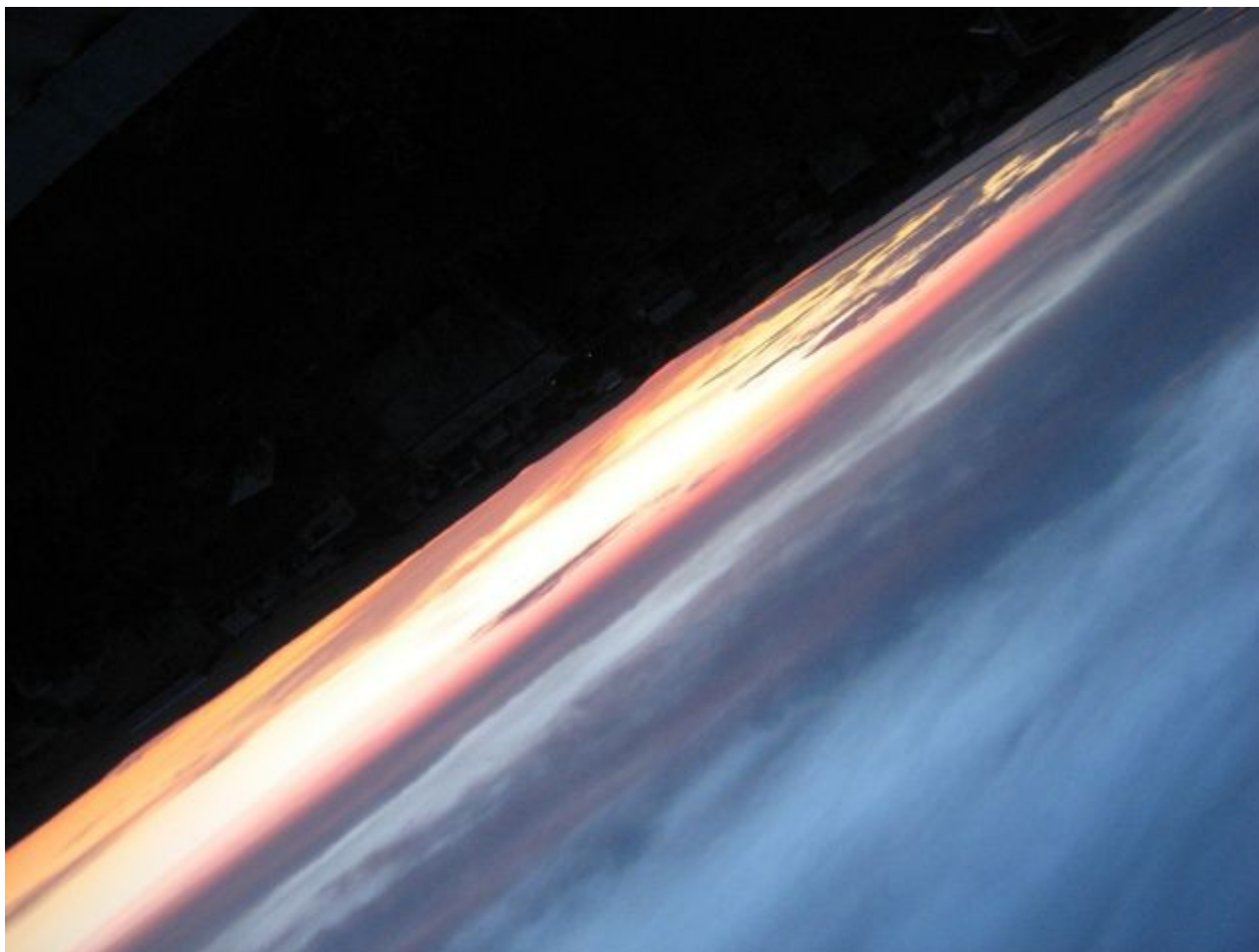
Вид с крыши

В экспедиции хорошо, а дома лучше. Вот такой космический вид открывается с крыши дома.