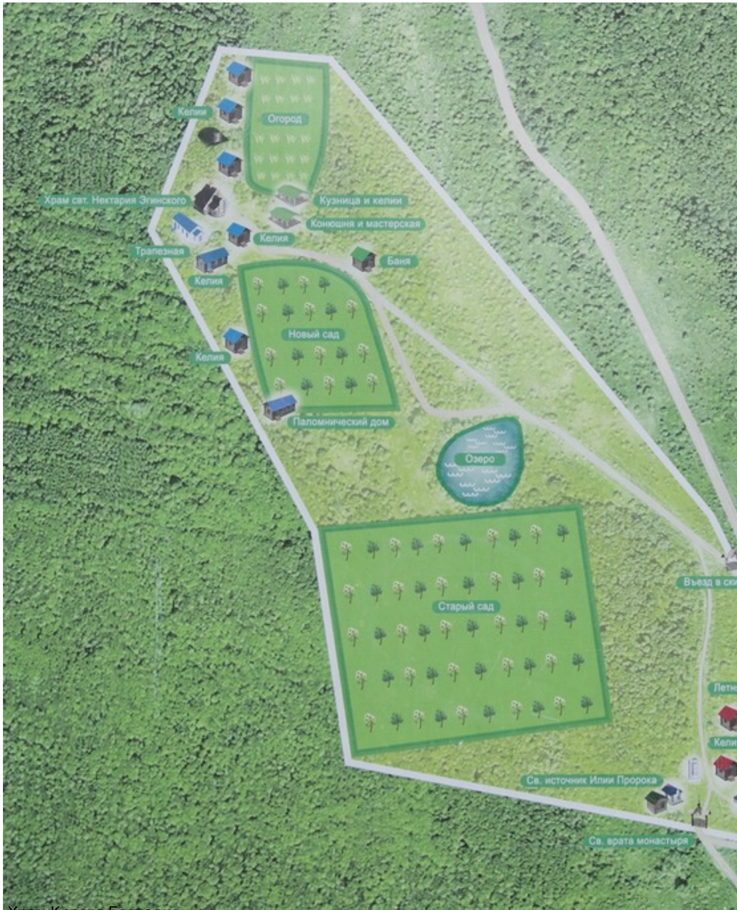
Храм Креста Господня.

07.09.2015 22:21 - Обновлено 11.09.2015 11:59